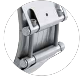
NORMACONNECT® FLEX 3 boru kaplini; ekstra bant geniřliđi 211 mm