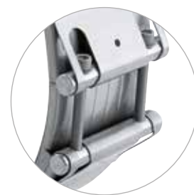
Potravní spojka NORMACONNECT® FLEX 3 s velmi širokou objímkou, šířka 211 mm